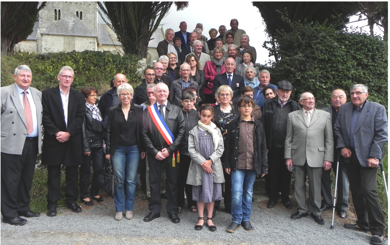
Des jeunes SAINT FLOXELAIS sont venus participer à la cérémonie religieuse

Cette année, sept aînés ne pouvant venir pour raison de santé, ont reçu un panier garni.