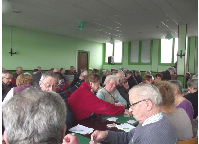
Bonne participation aux concours de belote

Nous avons également organisé des concours de belote qui ont rencontrés de réels succès avec une quarantaine d'équipes présentes.