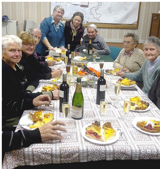
Voilà ce qui arrive lorsque l'on fête plusieurs anniversaires le même jour !

N'oublions pas les bons moments de convivialité où nous fêtons les anniversaires des membres du club et notre traditionnel repas de Noël avec une nouveauté pour 2014 puisque chacun a reçu un cadeau.